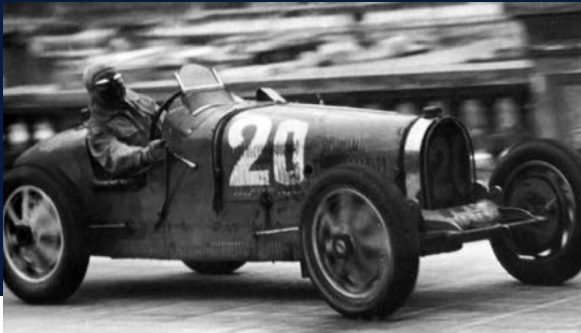
1931 BUGATTI TYPE 51 GRAND PRIX #51128 6e au Grand Prix de Monaco 1936 avec Marcel Lehoux, ex- Trintignant