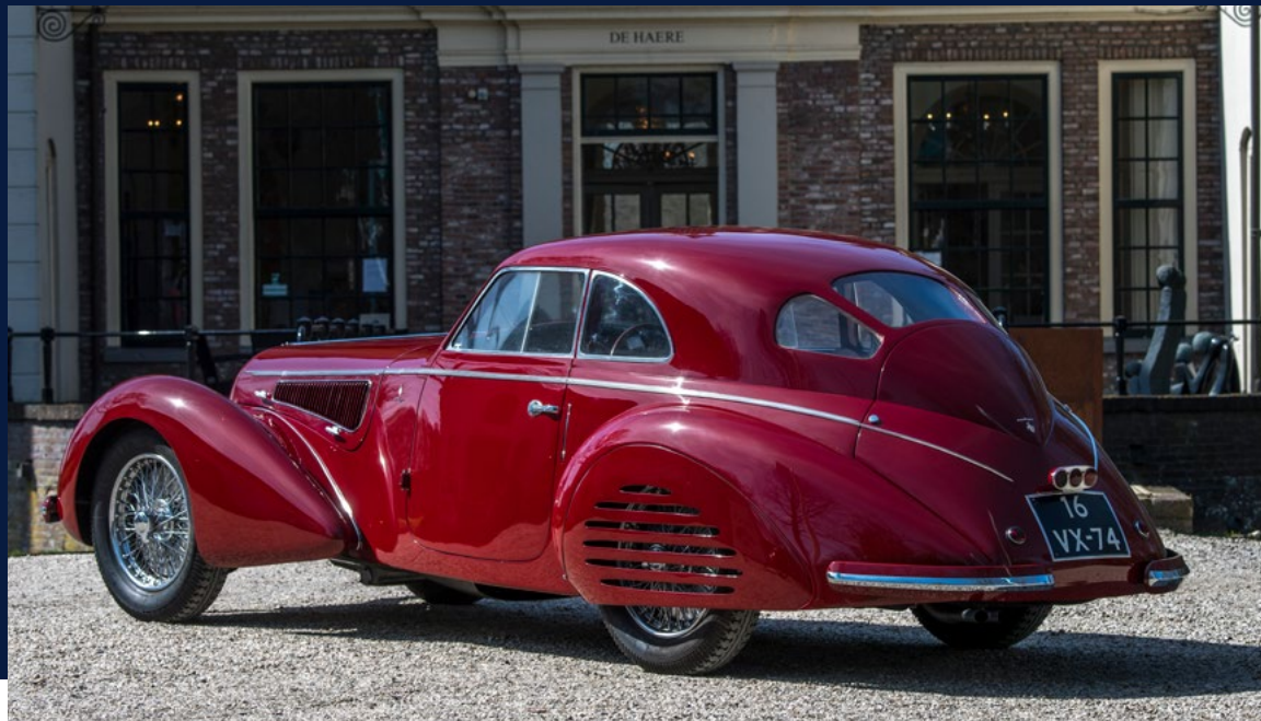
1939 ALFA ROMEO 8C 2900 TOURING BERLINETTA #412024 Estimation : 16 - 22 M€