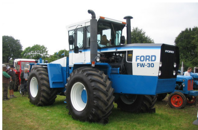
Ford-Steiger FW30, début des années 1980

Quatre tracteurs représenteront la marque Ford , de l'antique Fordson F de 1917 au Ford-Steiger FW30 du début des années 80, qui avec ses 7m de long, 3,5 m de hauteur pour un poids de 14 tonnes imposera sa large silhouette de colosse.